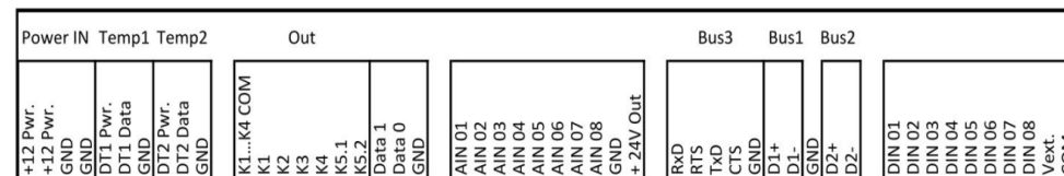
Рис.2 Схема расположения клемм устройства ИНДЕЛ-1708.2