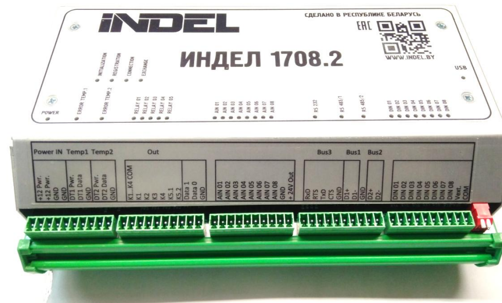
Рис.3 Устройство ИНДЕЛ-1708.2